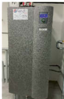
Installationsbsp.: Luftwärmepumpe Außengerät wandhängend mit Hydraulikstation inkl. WW Speicher

Sie suchen eine Firma auf die Sie sich verlassen können? Sie wollen modernste und energieeffiziente Technik? Sie wollen alles aus einer Hand ob Heizung, Lüftung und Sanitär? Wir sind stets am Ball wenn es um innovative Technik geht und setzen diese gerne zu Ihrem Vorteil ein.